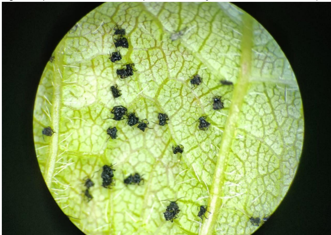
Figure 2. Aphids after treatment with a product containing the active substance acetamiprid

Obrázek 2. Mšice po ošetření přípravkem s účinnou látkou acetamiprid