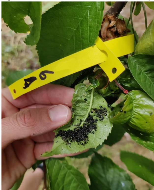
Figure 1. Marked shoot infested with cherry blackfly

Obrázek 1. Označený výhon napadený mšicí třešňovou